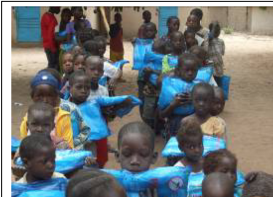
DONS DE VIVRES