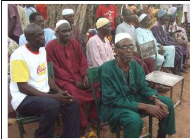
Sensibilisation des populations à la gestion de déchets