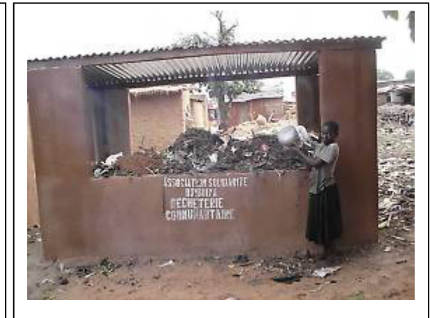
déchetterie construite en 2011

TOTAL GENERAL DES DEPENSES AU COUR DE L'ANNEE 2011 EST =8374600 RESULTATS L'ANNEE SCOLAIRE 2010-2011